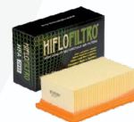
Φίλτρο Αέρος Hiflofiltro Κωδ.: HFA7913