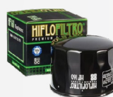
Φίλτρο Λαδιού Hiflofiltro Κωδ.: HF160