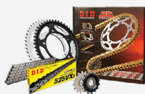
Set Moto DID - JT Αλυσίδα - Γρανάζια