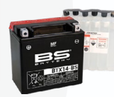
Μπαταρία BS Battery Κωδ.: BS-BTX14-BS