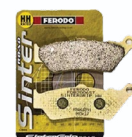
Τακάκια Εμπρός Ferodo Δεξιά Κωδ.: FD-FDB2006ST