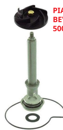
PIAGGIO BEVERLY 500