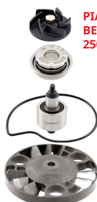
PIAGGIO BEVERLY 250