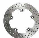
Δισκόπλακα Πίσω JT Braking Κωδ.: JTD5020