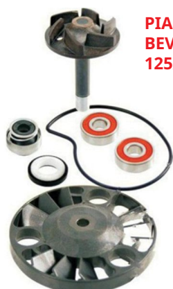
PIAGGIO BEVERLY 125/200