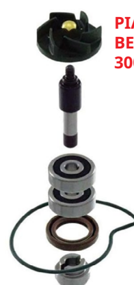
PIAGGIO BEVERLY 300